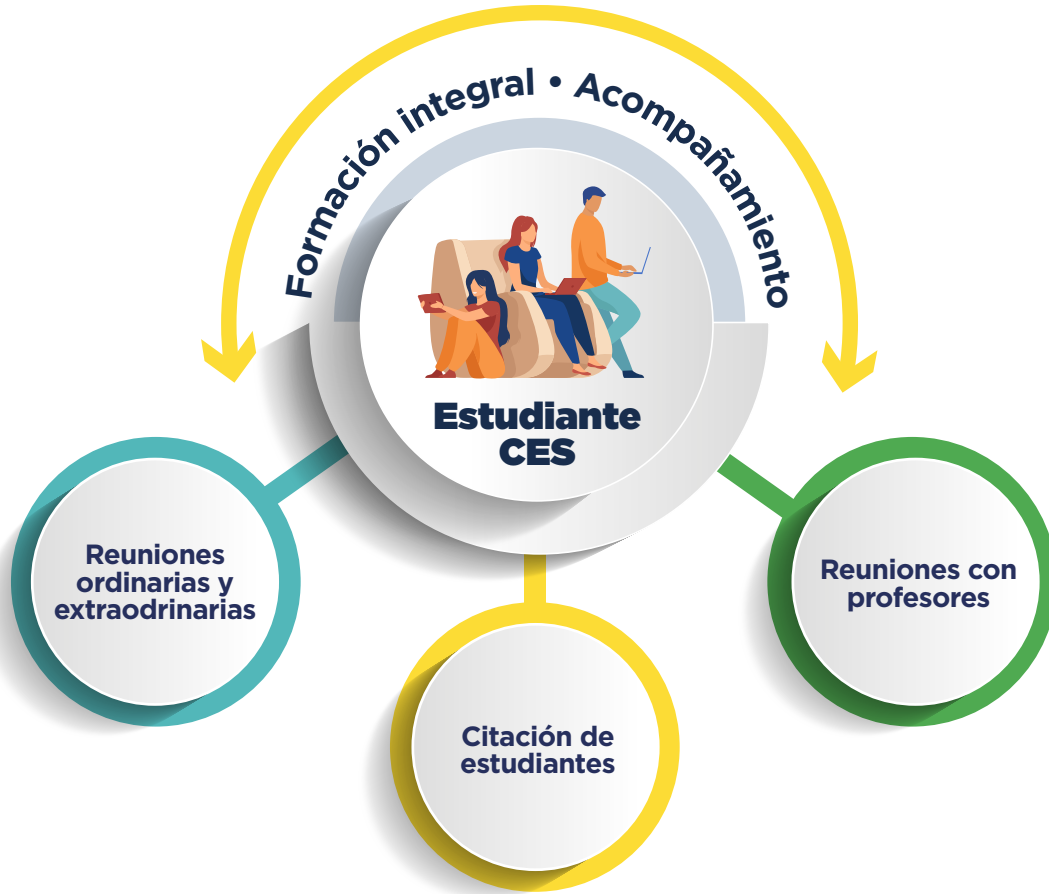
FIGURA 6. COMITÉ DE PROMOCIONES UNIVERSIDAD CES