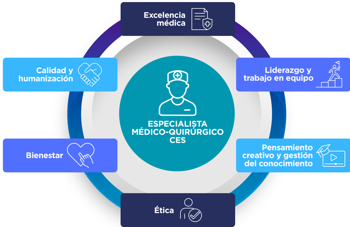
FIGURA 5. COMPETENCIAS DEL ESPECIALISTA MÉDICO-QUIRÚRGICO CES