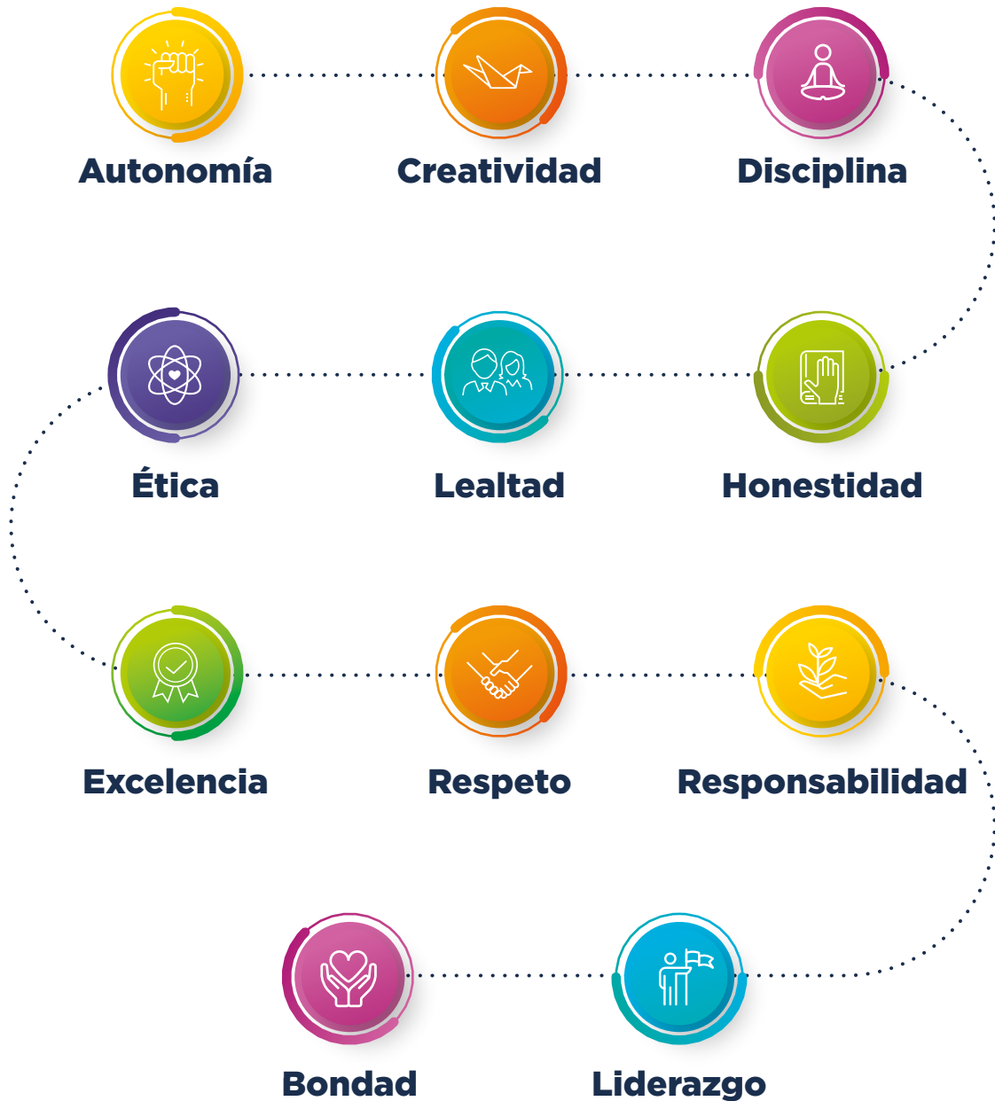
FIGURA 2. VALORES DE LA UNIVERSIDAD CES