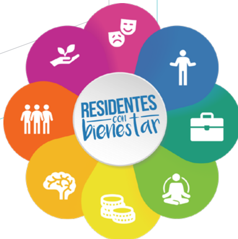
FIGURA 1. LOGO RESIDENTES CON BIENESTAR

Además, desde el año 2019 la División de Postgrados Clínicos de la Universidad CES creó el programa de Residentes con Bienestar el cual busca desarrollar e implementar un espacio de promoción de la salud mental en los estudiantes, creando actividades de intervención psicológica en donde se enseñen herramientas de autocuidado, autoeficacia y trabajo en equipo, buscando así un ambiente emocionalmente saludable, que permita el desarrollo integral del estudiante, centrándose en su calidad humana y orientación al otro.