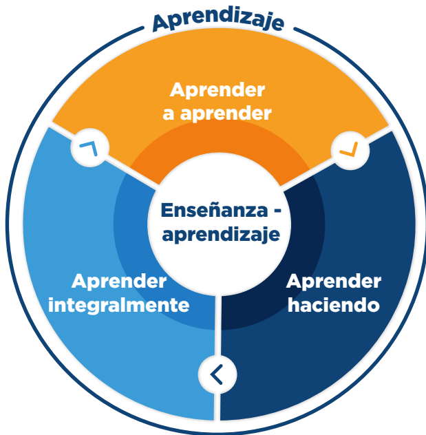
FIGURA 3. ELEMENTOS PEDAGÓGICOS DE LA UNIVERSIDAD CES